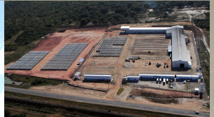
Fábrica de Tubos de Aço Hydrostec / Pecém