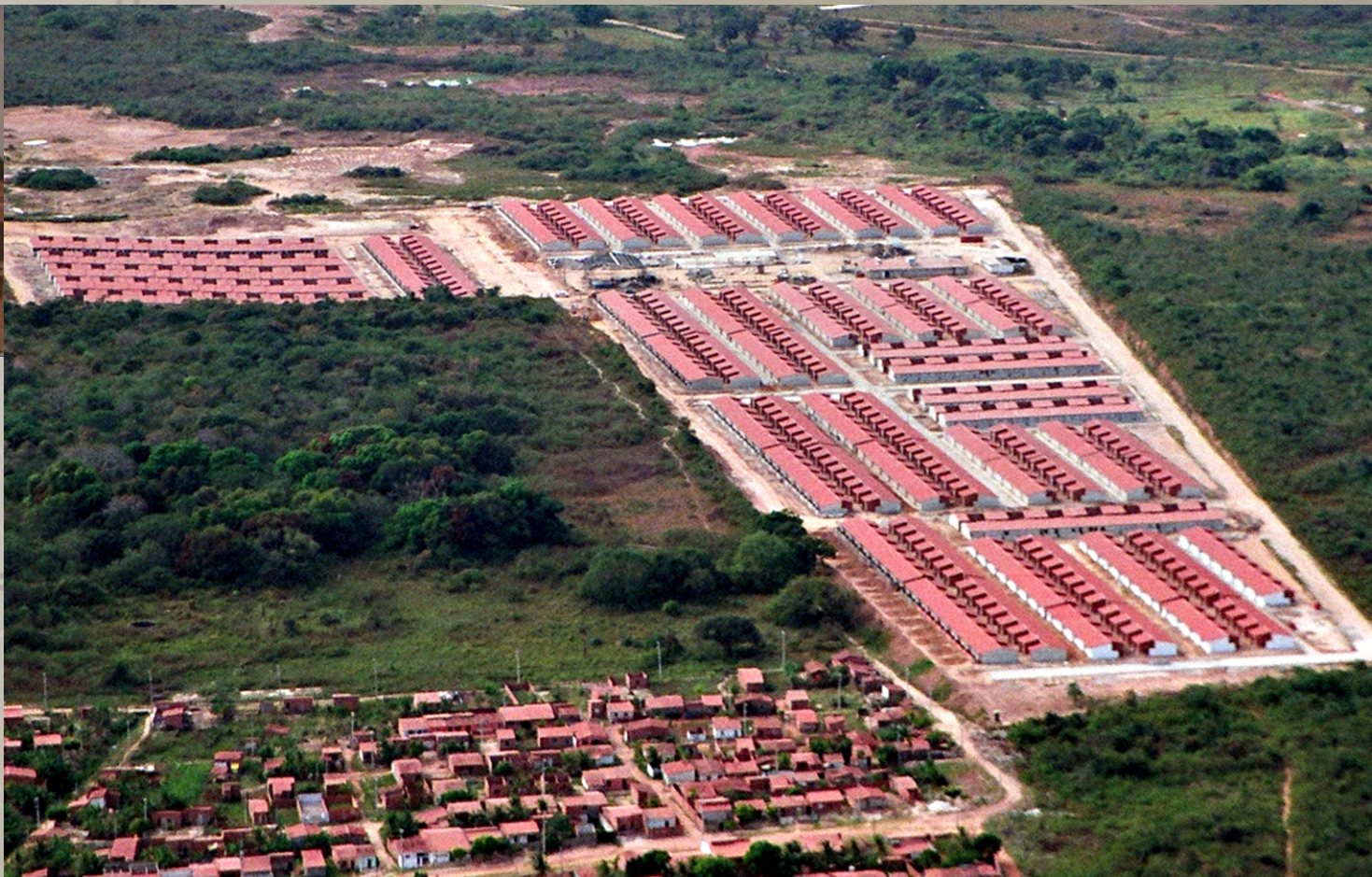
Conjunto Habitacional Lagoa da Zeza PM Fortaleza