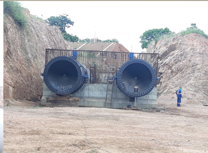
Válvulas Dispersoras Dn2600mm Barragem São Gonçalo