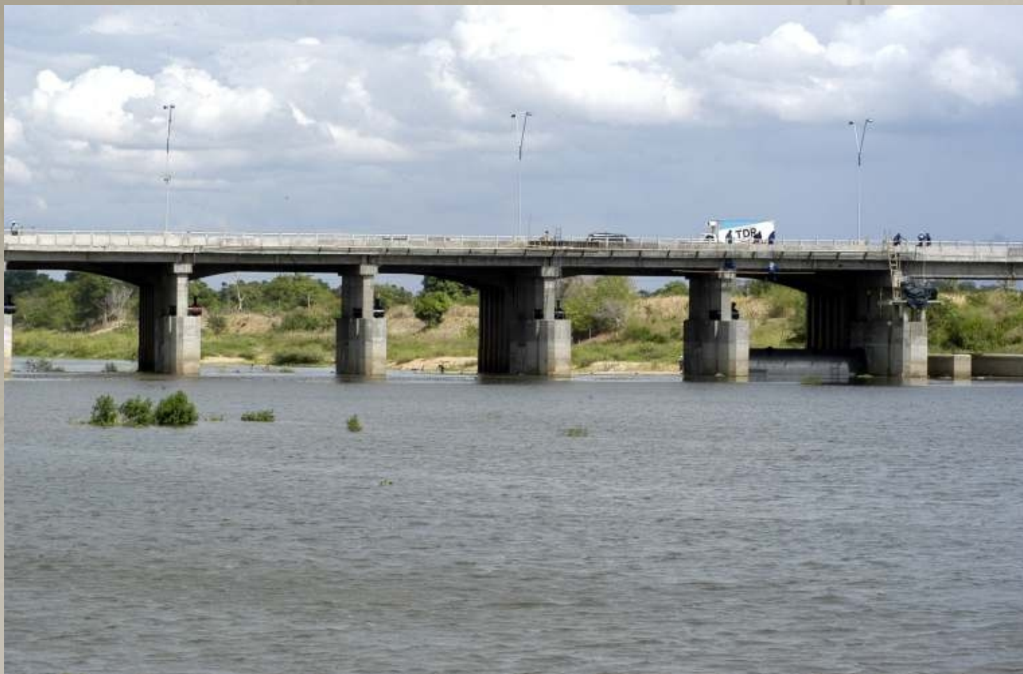
Ponte Oton de Alencar PM Sobral