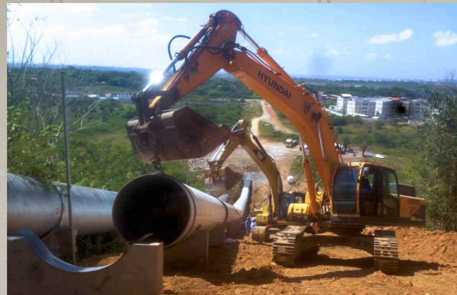
Adutora Taquarão CAGECE