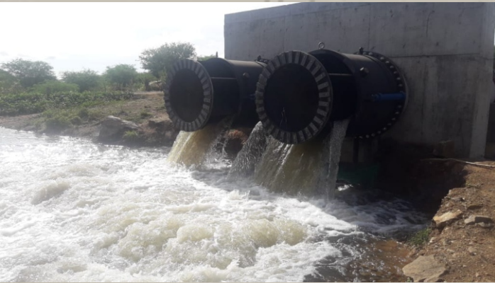
Válvulas Dispersoras Dn1600mm Barragem Poções