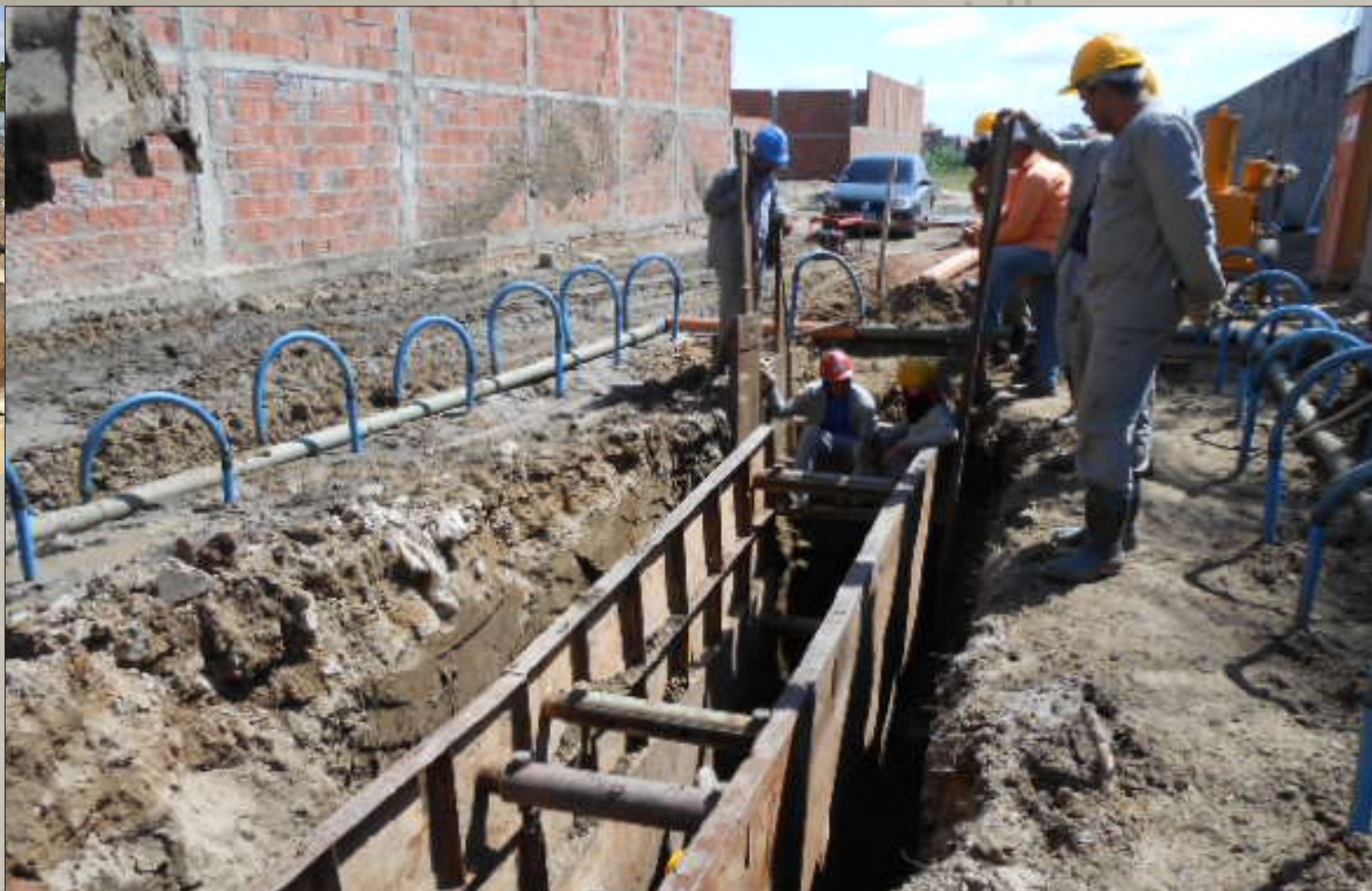
Saneamento ARACATI CAGECE