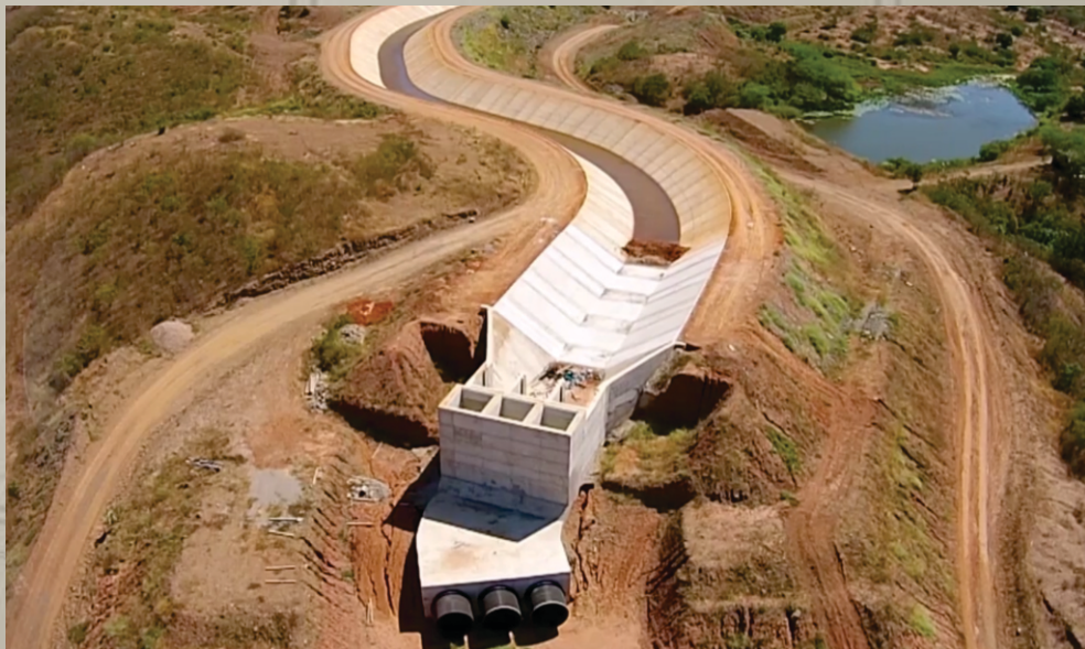
Cinturão das Águas do Ceará - Lote 01 Brejo Santo - CE