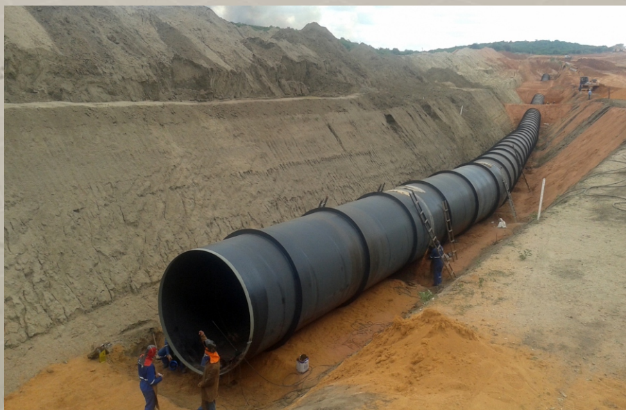
Cinturão das Águas do Ceará - Lote 01 Brejo Santo - CE