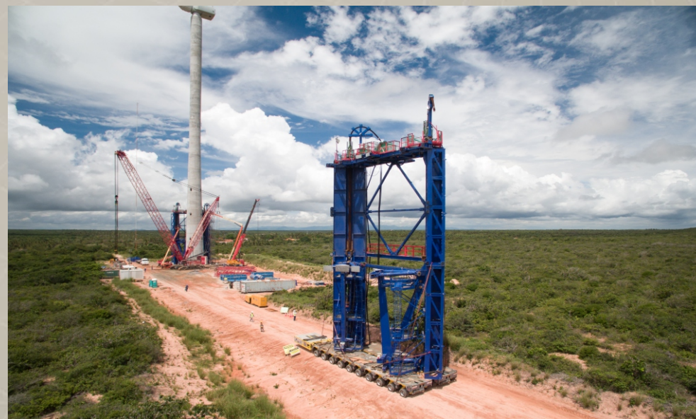
Parque Eólico Trairi-CE TRACTEBEL