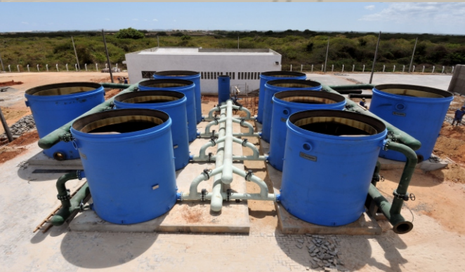
ETA ARACATI CAGECE