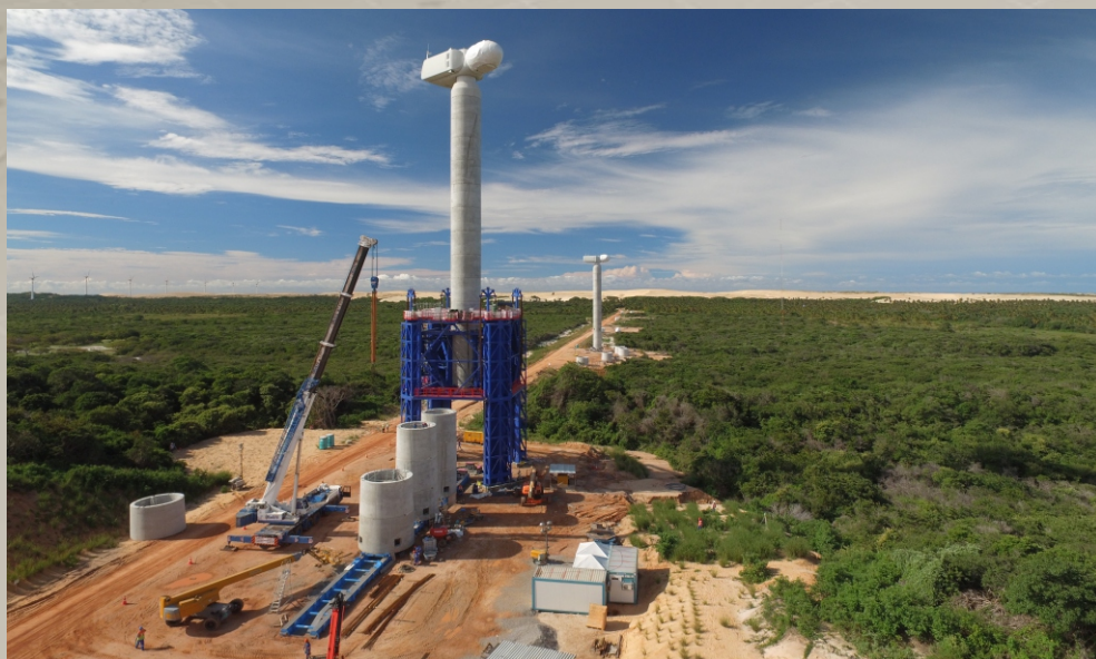
Parque Eólico Trairi-CE TRACTEBEL