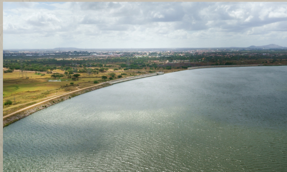
Barragem Maranguapinho SEC. DAS CIDADES