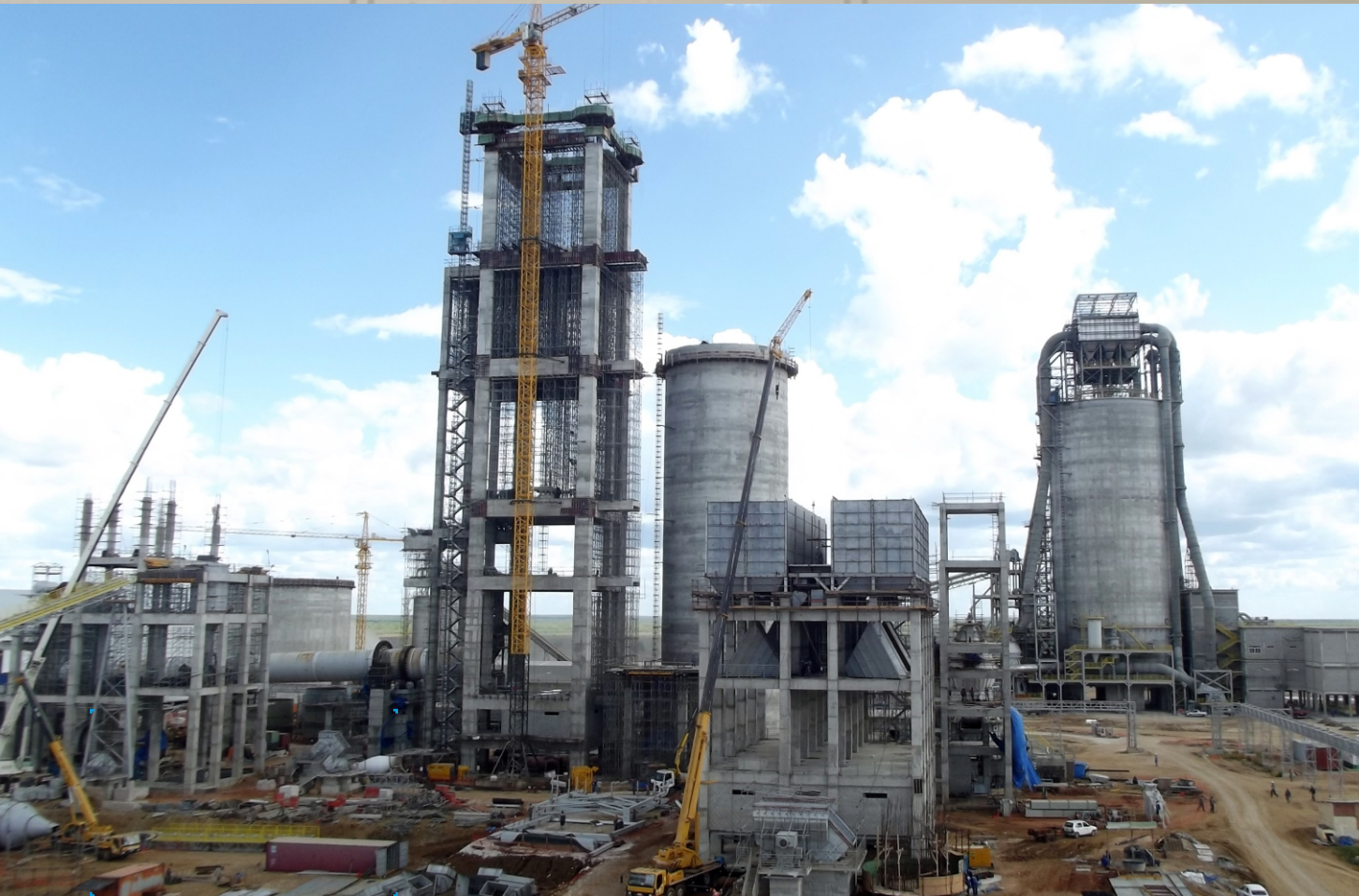
Fábrica Cimento Apodi Quixeré-CE