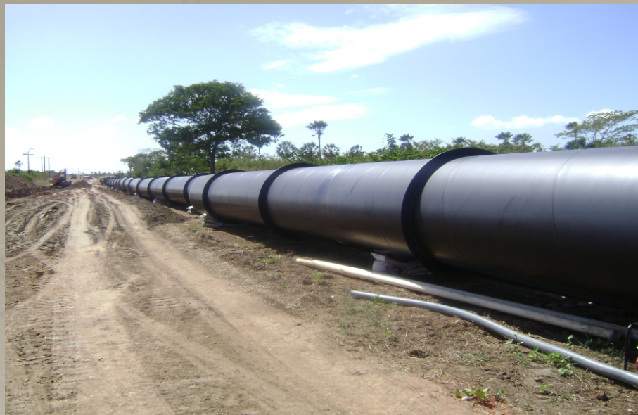
Adutora Salvador EMBASA