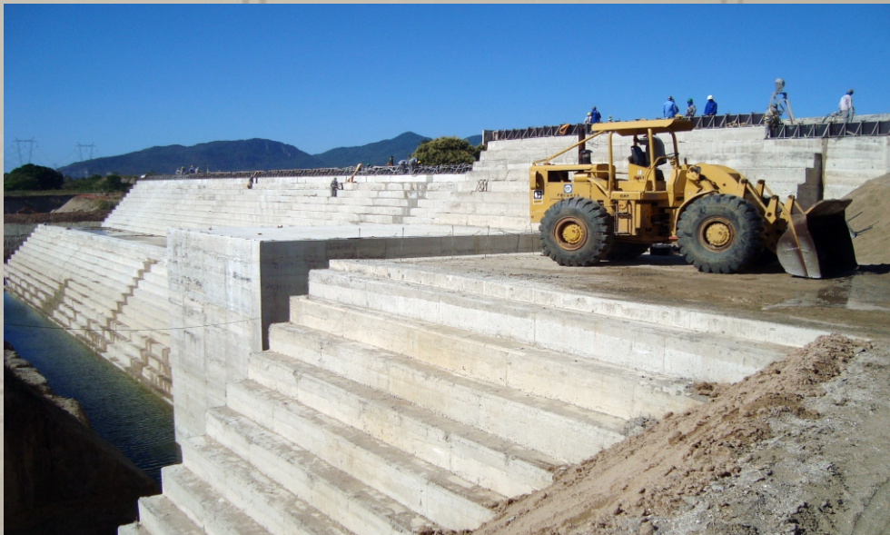
Barragem Maranguapinho SEC. DAS CIDADES