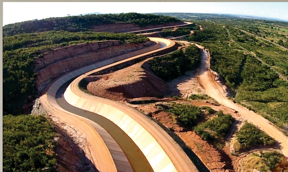
Cinturão das Águas do Ceará - Lote 01 Brejo Santo - CE