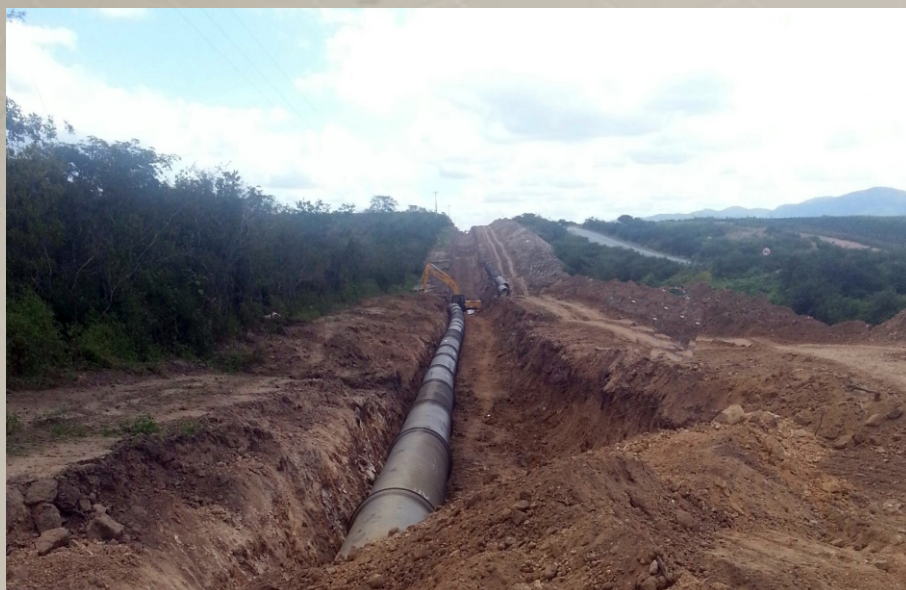
Adutora do Agreste / Arcoverde-PE COMPESA