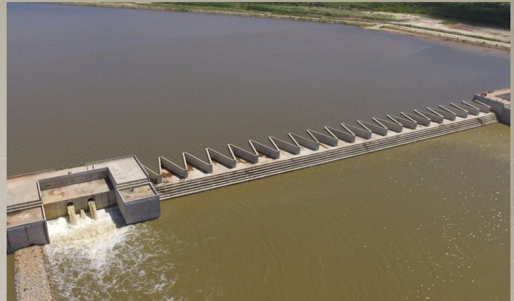
Barragem Rio Cocó SEC. DAS CIDADES