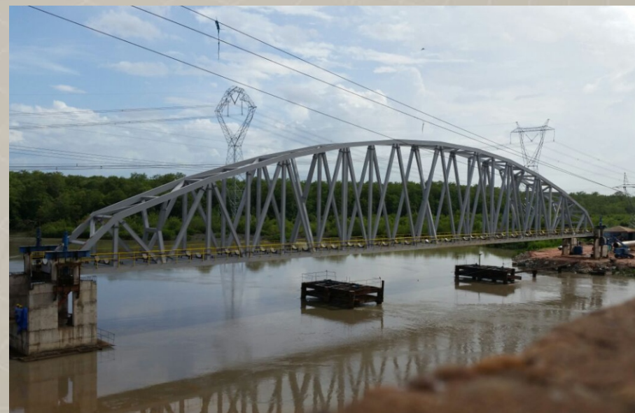
Adutora Perizes / Maranhão CAEMA