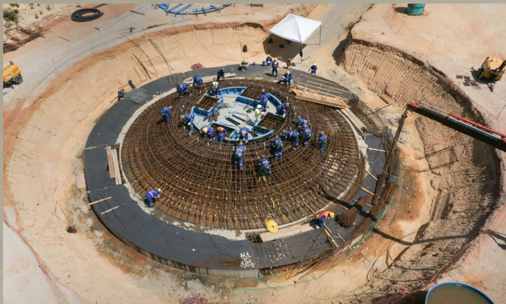
Parque Eólico Trairi-CE TRACTEBEL