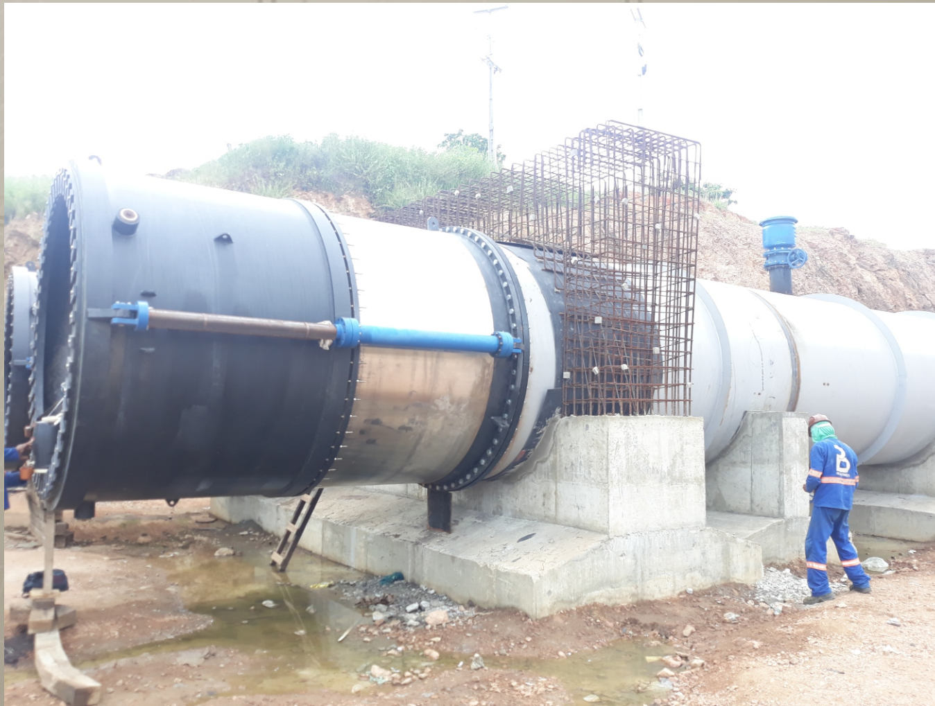
Barragem São Gonçalo