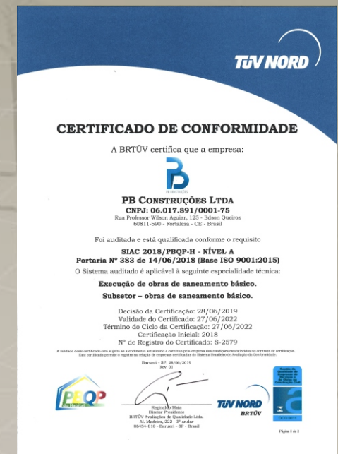
PBQP-H (NÍVEL A) OBRAS SANEAMENTO