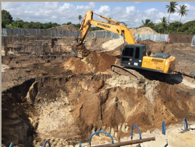
SES Água Fria - Bacias CD 1 / 2 / 3 CAGECE