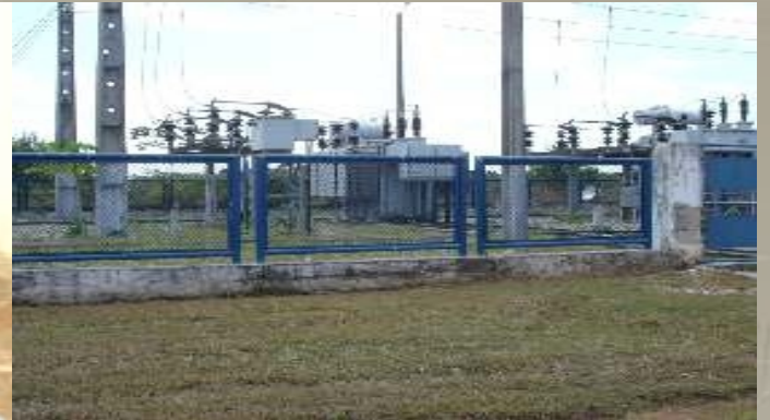
Subestação Elétrica 10MVA CAGECE