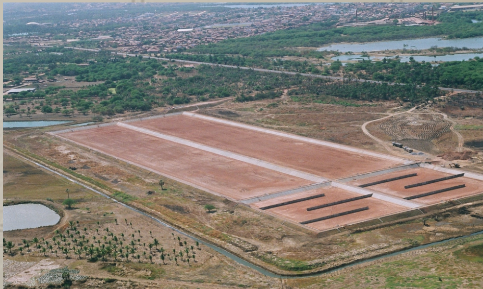
Lagoa de Estabilização de Aracati-CE