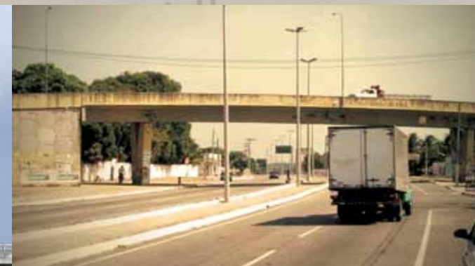
Viaduto Washington Soares Fortaleza-CE