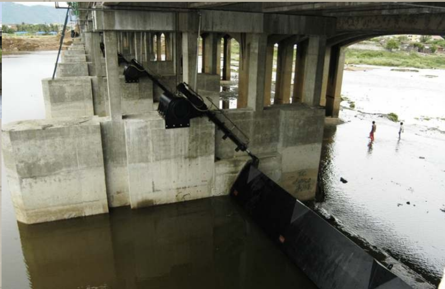
Barragem José Cândido de Paula Pessoa PM SOBRAL