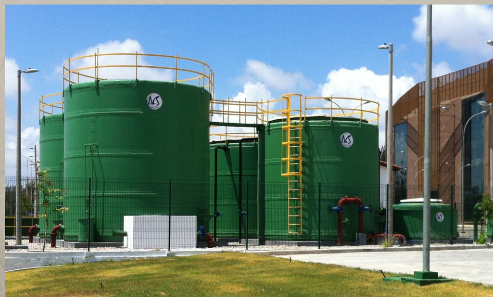
ETE Bacia CD 2 - Centro de Eventos do Ceará CAGECE