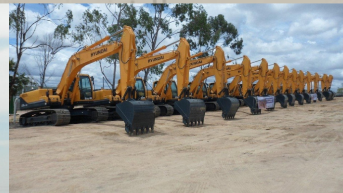
Adutora Agreste COMPESA