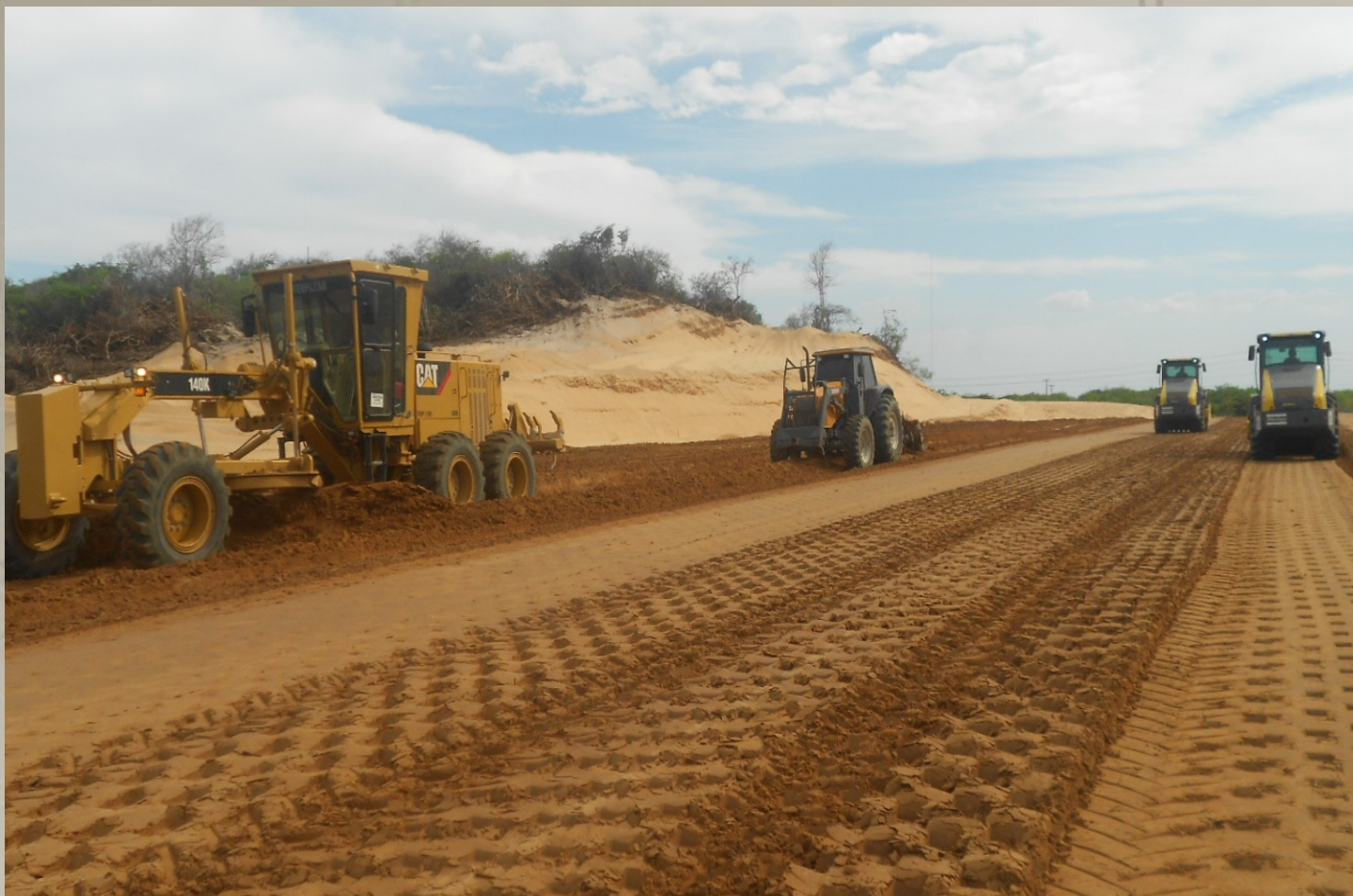
Parque Eólico Trairi-CE TRACTEBEL