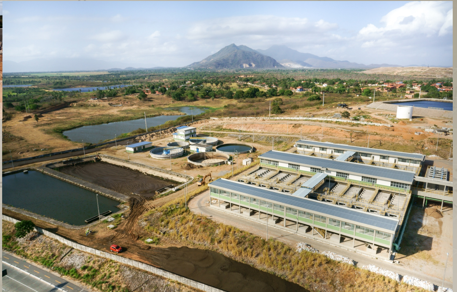
ETA OESTE (2ª Etapa) CAGECE