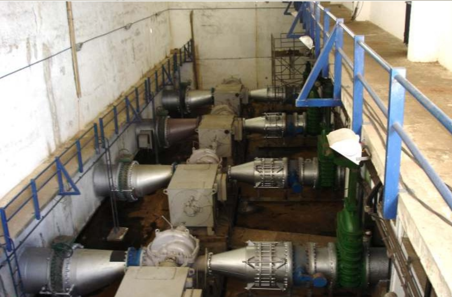
Conjunto Eletro-bombas ETA GAVIÃO