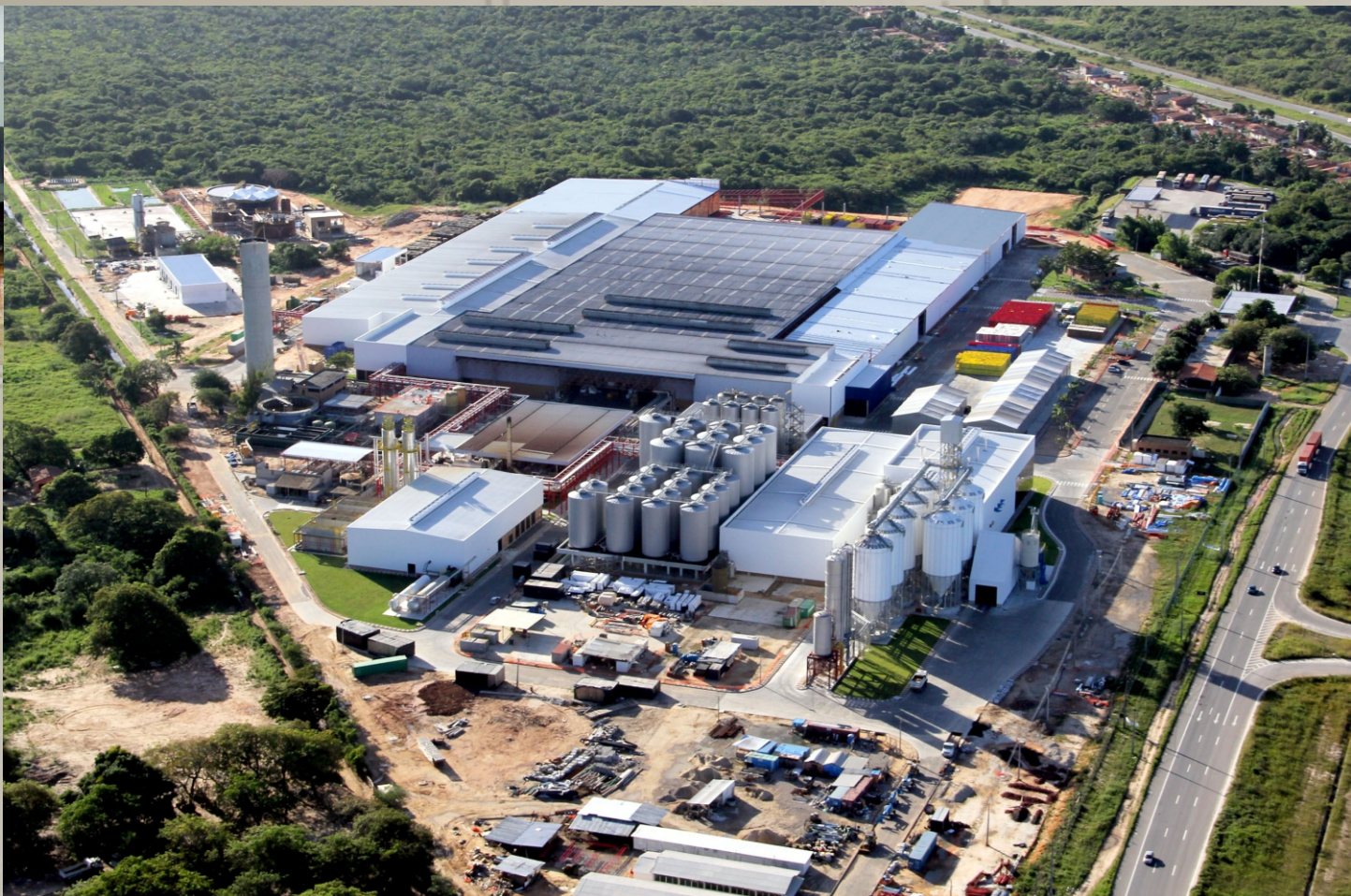
Fábrica AMBEV - Aquiraz-CE